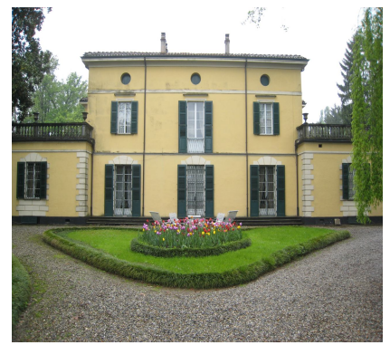
Casa di Giuseppe Verdi