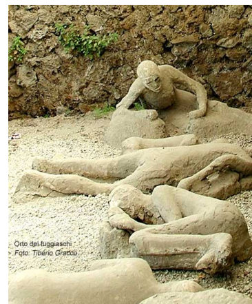
Orto dei fuggiaschi