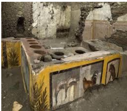
Termopolio di Pompei