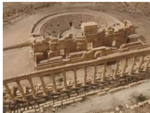
TEATRO DI PALMIRA prima della distruzione