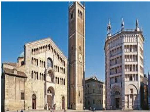
Il duomo e il Battistero

Il mio viaggio si conclude a Pompei, con la trasmissione di Rai 2 "Pompei ultima scoperta", la cittadina rasa al suolo dall'eruzione del Vesuvio nel 79 d.C. dove recentemente sono state fatte alcune scoperte tra le quali un termopolio (l'odierna tavola calda) dove durante gli scavi sono stati rinvenuti alcuni resti di cibo e del vino, al contempo sono rinvenute due ville nelle quali sono stati ritrovati i corpi di due fuggiaschi. Dai resti delle case, ancora in piedi, si possono ammirare le decorazioni ricche di disegni, in particolare figure di animali e scritte dell'epoca. Questo è stato il mio viaggio di Natale, pieno di meraviglie e sorprese.