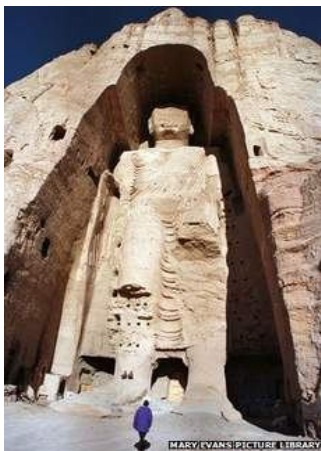
BUDDA DELLA VALLE DI BAMBIYAN prima della distruzione