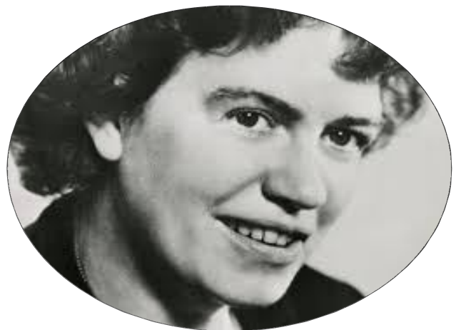
Dott.ssa Margaret Mead

estremiste e a soccombere. Come sempre, ciascuno di noi nel suo ambiente lavorativo e sociale, se sa far scelte che uniscono, di condivisione e di sostegno, collabora nel creare le fondamenta di una vera società civile.