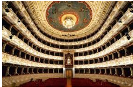
Il Teatro Regio